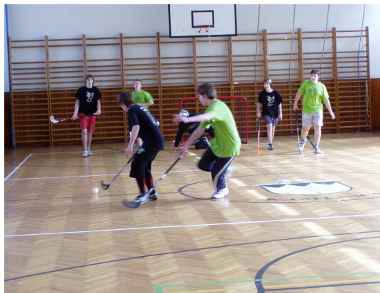
Turnaj ve florbalu