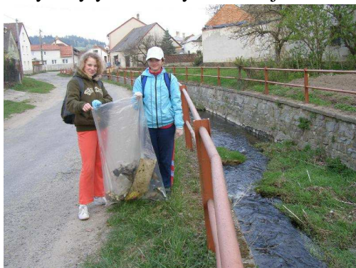
Šestáci se činí při úklidu potoka

Projekt začal ráno tím, že se učitelé 1. i 2.stupně ráno vydali se svými třídami na přidělené úseky určené k úklidu. V korytě potoka a jeho přítoků byly vysbírány naplavené odpadky, ze kterých největší část tvořily stejně jako i v minulých letech plasty – ty byly tříděny do pytlů a odvezeny zaměstnanci obce. Ostatní odpady – sklo, kovy – byly odneseny do kontejnerů v obci.