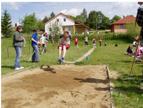
Skok daleký při školním atletickém čtyřboji