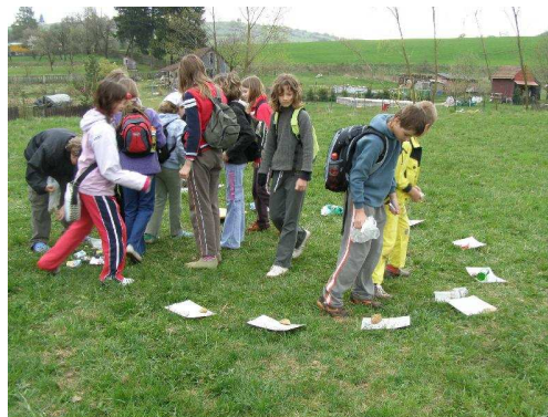
Pátáci separují odpad

Po náročném úklidu následovala Vodní naučná stezka , na které všichni žáci školy absolvovali pět stanovišť: