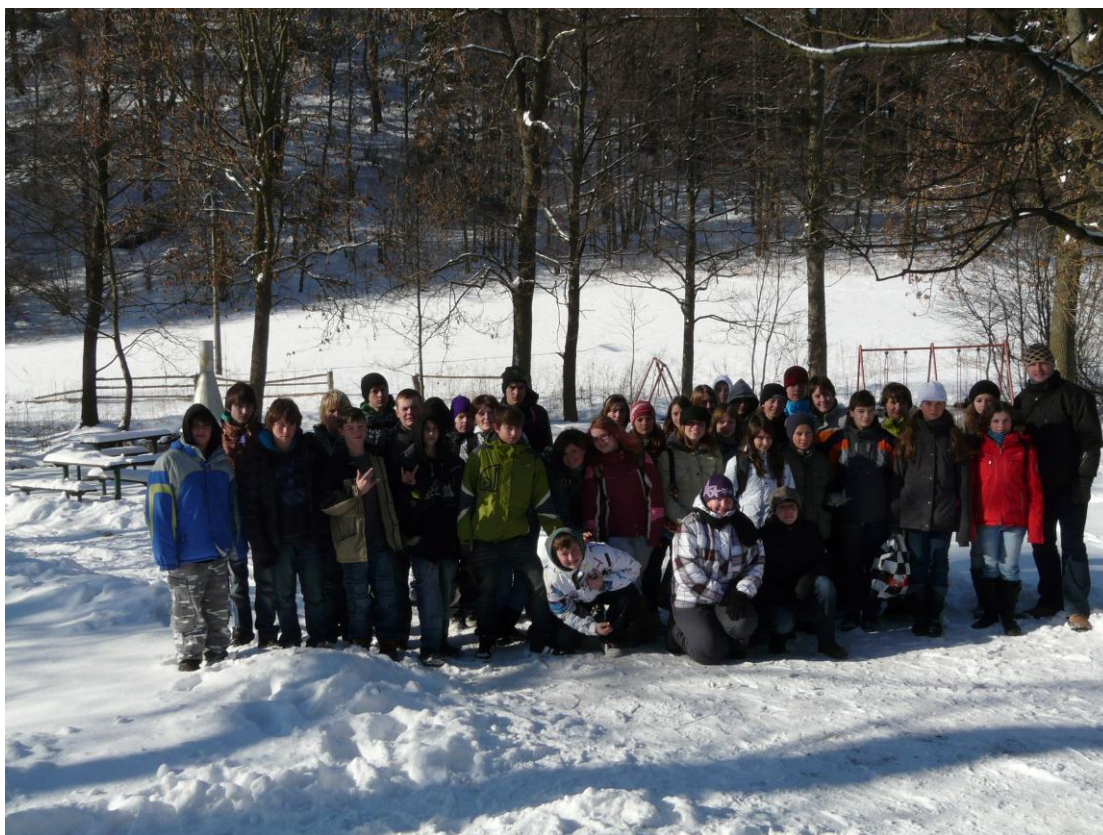
Účastníci lyžařského výcvikového kurzu 2011

Zbývající žáci 7. třídy se nezúčastnili kurzu z důvodu zdravotního osvobození nebo nemoci.