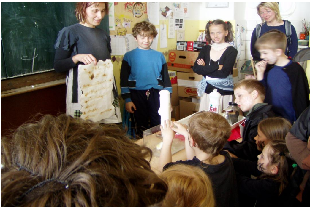
Čarodějnický den, 4. třída

Žáci předvedli svá připravená vystoupení za podpory rodičů a dalších diváků. Posuzování bylo velice náročné, tudíž si každý alespoň nějakou cenu odnesl.