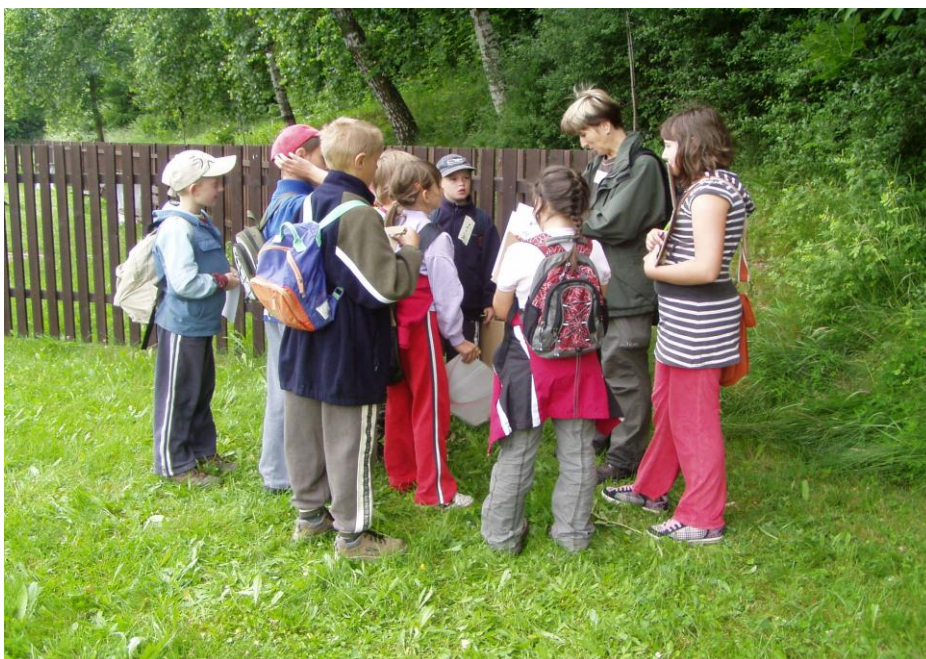
Lesní pedagogika, 3. třída