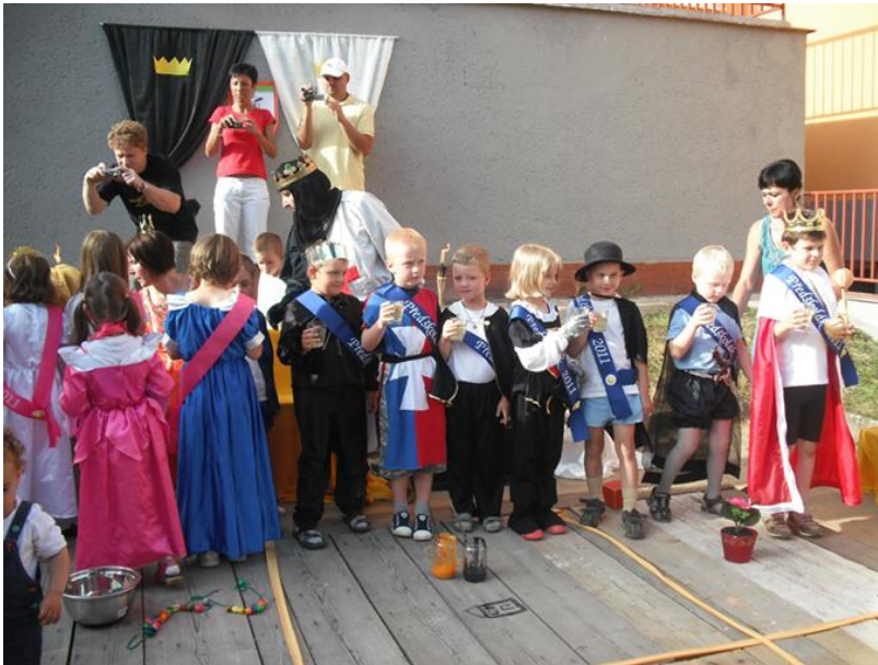
Pasování předškoláků při závěrečném vystoupení dětí MŠ pro rodiče