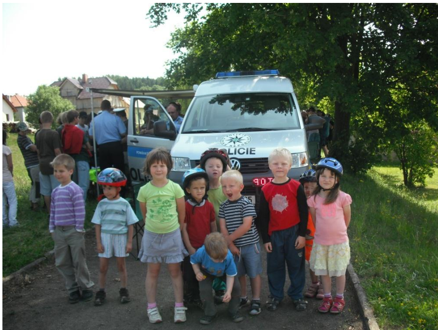
Dopravní den v ZŠ a MŠ s Policií ČR

Mateřská škola spolupracuje s policií České republiky, která v mateřské škole pořádala akce zaměřené na prevenci sociálně patologických jevů. Předškolní děti se také zúčastnily akce na dopravním hřišti v Jihlavě, která byla pořádána ve spolupráci s Vyšší policejní školou.